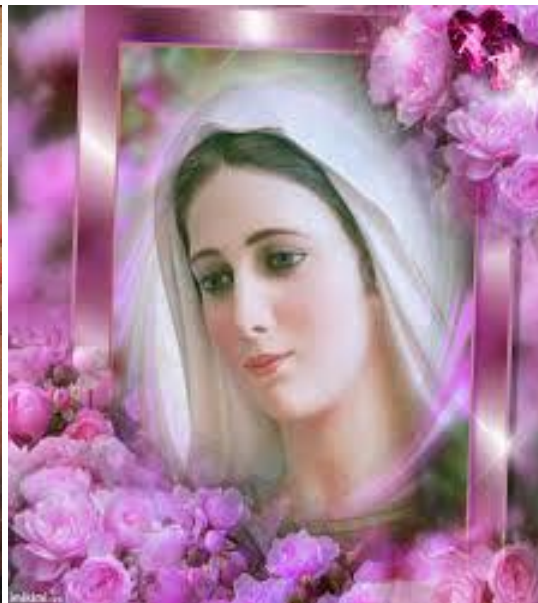
Marie Reine de la Paix à Medjugorje