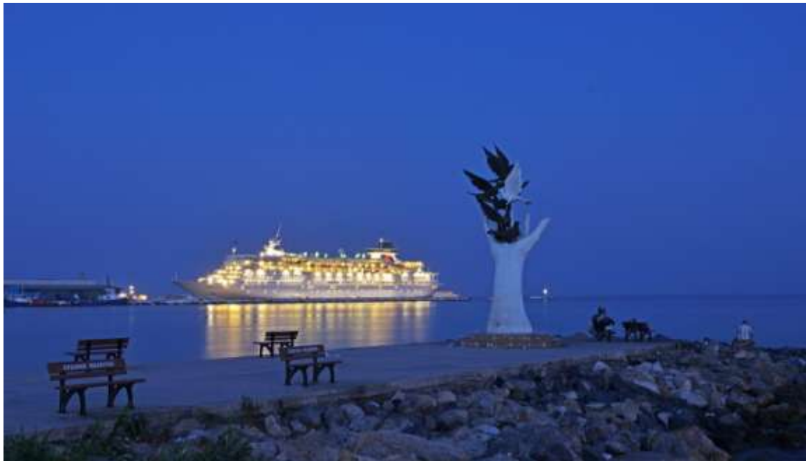
Monument the Hand of Peace à Kussadasi

Votre visite en bus de la ville antique d'Éphèse vous fera voyager dans l'âge d'or qui a modelé ce centre pivotant de commerce et de spiritualité. Bâtie il y a 3000 ans, la ville d'Éphèse a modelé l'histoire des civilisations grecques, turques et chrétiennes de par son site privilégié, sélectionné d'après la légende par l'oracle de Delphes. Site de pèlerinage en raison de sa proximité du temple d'Artémis, une des 7 merveilles du monde, et de la présence de personnalités chrétiennes majeures, tels que l'apôtre Paul et Jean et la Vierge Marie, à l'intérieur des murs de la ville, Éphèse est actuellement un des sites romains archéologiques les plus vaste de la Méditerranée. Ses rues et vestiges exceptionnellement bien préservés témoignent de sa splendeur à l'âge d'or. En explorant ce site du patrimoine mondial de l'UNESCO, vous aurez l'opportunité d'expérimenter l'effervescence culturelle séculaire de l'Agora d'Éphèse, de découvrir l'Odéon, les maisons des patriciens, le beau temple d'Hadrien et l'impressionnante bibliothèque de Celsus. Vous vous adonnerez également au marchandage traditionnel lors de la dernière étape de notre visite, où vous pourrez acheter des produits locaux, des bijoux traditionnels, de la maroquinerie, des cosmétiques ou d'autres souvenirs de Kussadasi.